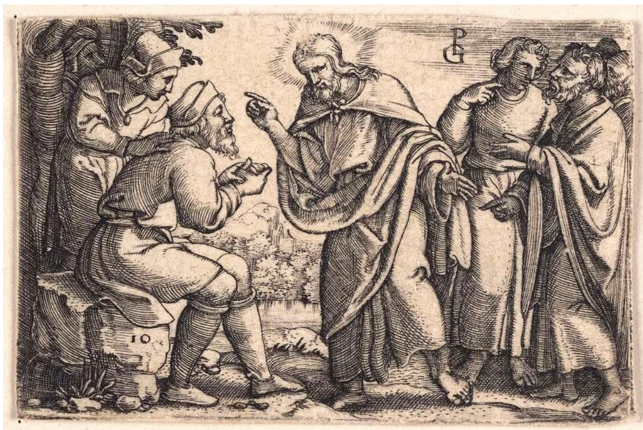
Jezus geneest de blinde

“God geneest van alle kwaaltjes”. Hoe leg je dat uit aan iemand die net zijn of haar kind heeft begraven? Zijn of haar vader of moeder, broer, zus, vriend of vriendin die veel te jong (in onze ogen) is gestorven? Hoe leg je dat uit aan iemand die terminale kanker heeft? Waar zijn de mensen met de ‘gave van genezing’ op het moment dat zo’n mens in het graf wordt gelegd? Waar zijn ze als mensen verdriet hebben, of teleurgesteld raken in God omdat de genezingen en wonderen uitblijven?