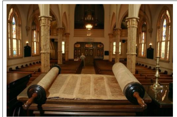
Synagoge gezien vanaf de "Biema"

Paulus schrijft dus aan deze gemeente die niet door hem of één van de andere apostelen is gesticht, maar is ontstaan uit Joodse gelovigen die in Jeruzalem het Evangelie hoorden en het meenamen naar Rome. Ondanks het feit dat hij niet de stichter is van deze gemeente schrijft hij met groot gezag; dat kon ook want hij was immers een Schriftgeleerde en op grond daarvan had hij sowieso gezag in de Joodse gemeenschap.