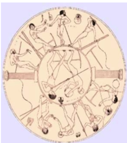
Afbeelding: Het 'gymnasia'

En in Psalm 103:18 lezen we: "over hen die zijn verbond onderhouden, en aan zijn bevelen denken om die te doen ."